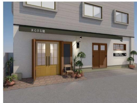
テント：グライッシュグリーン