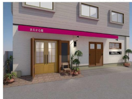
テント：チェリーピンク